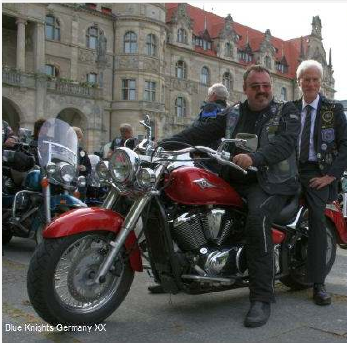
Blue Knights Germany XX

Gegenwart des Bürgermeisters übergaben sie eine Spende von 500 Euro an den Verein „ Kleine Herzen Hannover “, der die Unterbringung von herzkranken Kindern in der dortigen Medizinischen Hochschule verbessern will.